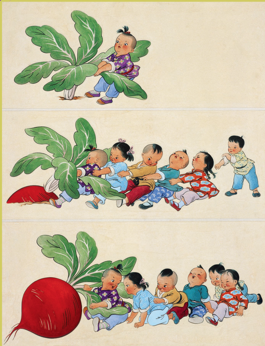
中国美术馆馆藏作品《拔萝卜》 特伟 年画 1954年

（画家特伟先生把一组拔萝卜的过程动作展示在同一个画面中，让故事有连续性的发展。）