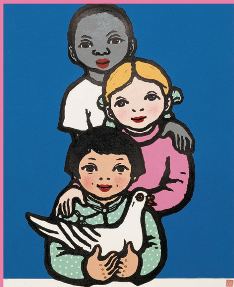
中国美术馆馆藏作品 《我们要和平》李平凡 版画 1959年

《我们要和平》是画家李平凡创作的套色木刻版画，它是木刻版画的其中一种，指以几块木版套印出两种以上颜色的版画。作品展现了不同肤色的小朋友共同的梦想：热爱和平，期盼世界和平。